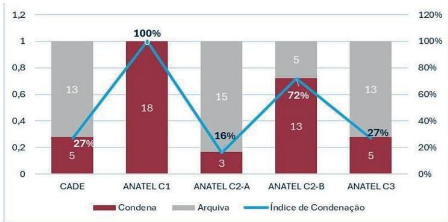
Table 6 – Convictions by CADE and in the Different Scenarios of PL 2.768

Looking at the conviction rates, Scenario 1 (interpreting Bill 2768 as imposing categorical obligations) seems unacceptable as it completely stiffens differentiation strategies in the market without any consideration of the impacts on competition and possible benefits to consumers and innovation. Moreover, there might not even be market power among the agents, as highlighted above.