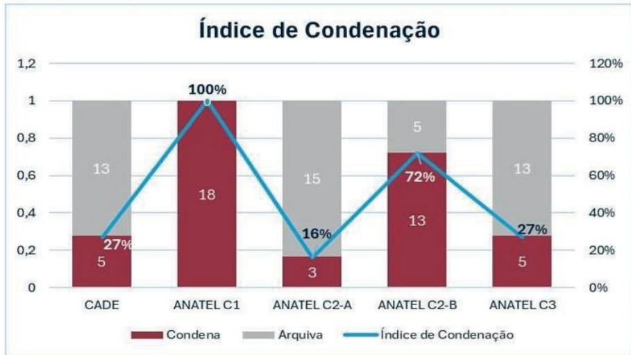
Tabela 6- Condenações pelo CADE e nos Diferentes Cenários do PL 2768

Olhando para os índices de condenação, o cenário 1 parece inaceitável, por enrijecer completamente as estratégias de diferenciação no mercado, sem qualquer consideração quanto aos impactos sobre a concorrência e possíveis benefícios aos consumidores e à inovação, além de inclusive poder sequer haver poder de mercado dos agentes, como destacado acima.